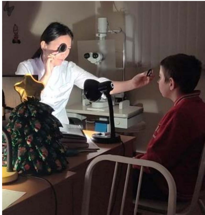
Специалисты больницы провели тщательный осмотр детей.